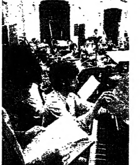
الخوري يراجع الكتيبة الموسيقية، ويلقي على البيانو

ولسنا هنا بصدد التمثيل بذكر الاسماء، فهناك قائمة طويلة لا تنتهي، تترواح باسماء الكبار من رجال العلم والادب والفن الذين وهبوا شعوبهم نتاج عقيرتهم، وجنوها في ساحة التحرير الوطني والدفاع عن قيم الانسان في الحرية والعدل والكرامة.